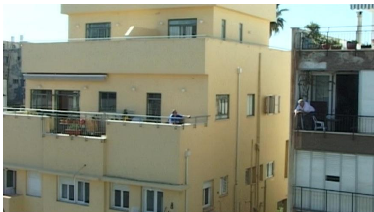
CHANTAL AKERMAN Là-bas (Allá), 2006 78'. Color.

Chantal Akerman: confinamientos La chambre (La habitación) Bélgica, 1972, color, muda, archivo digital, 11' Portrait d'une paresseuse/La Paresse (Retrato de una perezosa/La pereza) episodio de Sept femmes, sept péchés [Siete