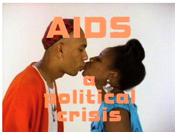
GRAN FURY. Kissing Doesn't Kill [Besarse no mata] Estados Unidos, 1990 Clor, sonido, vídeo, 2'10" (4 anuncios de 30'). Cortesía de Electronic Arts Intermix (EAI), Nueva York

Entre el pasado 8 de mayo y el 4 de junio tuvo lugar la primera parte del ciclo audiovisual Tiempos inciertos I , que versó sobre la experiencia del confinamiento y fue concebido para ser visionado en la web del Museo Reina Sofía durante aquella situación de excepcionalidad. Ahora llega Tiempos inciertos II. Representar la pandemia , que nos presenta como una serie de artistas y cineastas de distintas generaciones han abordado la representación de diferentes pandemias en diferentes periodos: la Edad Media europea en tiempos de la peste, la América de las plagas mortales a comienzos del colonialismo o el mundo occidental