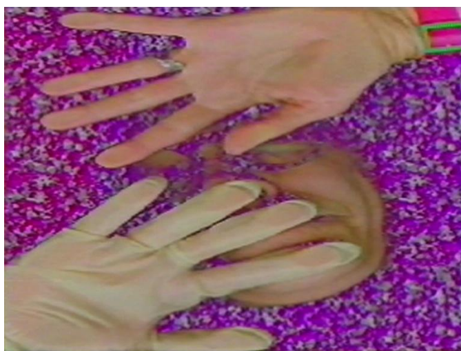
BARBARA HAMMER Save Sex [Proteger el sexo] Estados Unidos, 1993 Color, sonido, vídeo, 1'.

España, 1993, color, VO, vídeo, 2'15" (extracto)