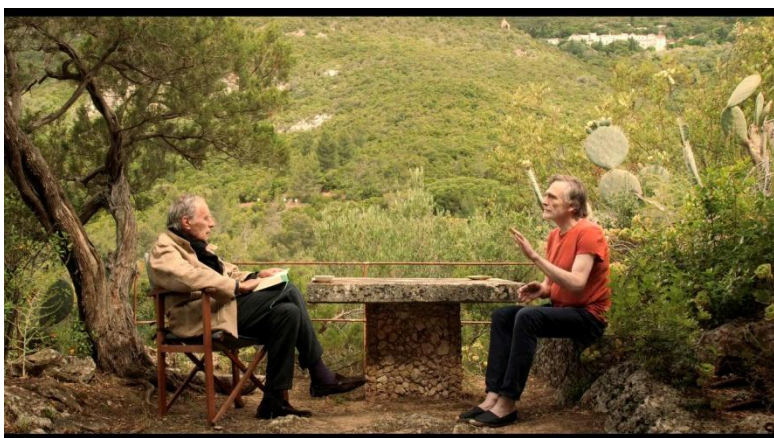
PIERRE LÉON, RITA AZEVEDO GOMES Y JEAN-LOUIS SCHEFER. Danses macabres, squelettes et autres fantaisies [Danzas macabras, esqueletos y otras fantasías] Francia, Portugal, Suiza, 2019 Color, VO en francés subtitulada al español, archivo digital, 110'

Preestreno nacional. Francia, Portugal, Suiza, 2019, color, VO en francés subtitulada al español, archivo digital, 110'